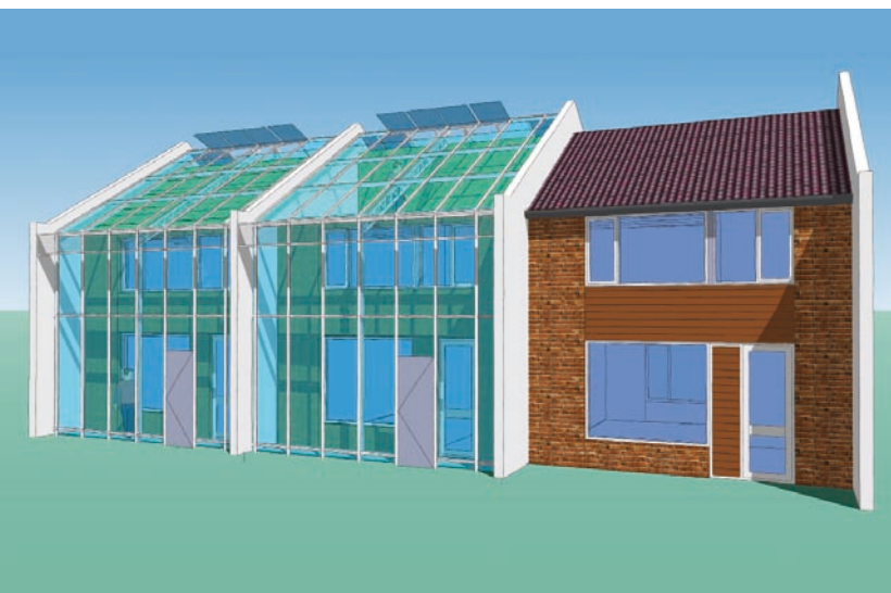
De kas wordt als een tweede huid om het huis gebouwd.